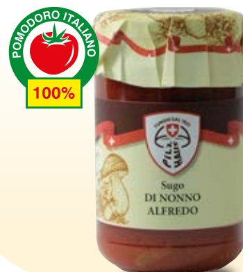
SUGO AI FUNGHI DI NONNO ALFREDO COD: 021PH_314_ML