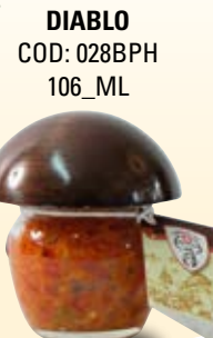
DIABLO COD: 028BPH 106_ML