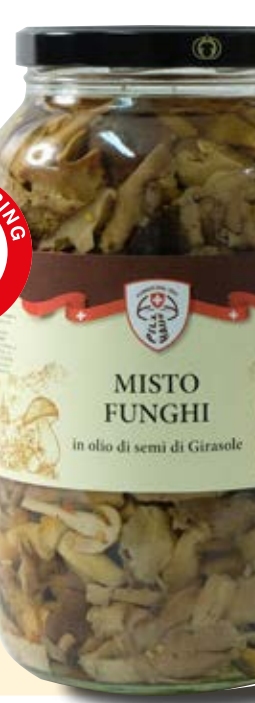
FUNGHI MISTI IN OLIO COD: 008CSPH_5_KG