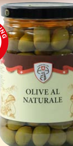
OLIVE AL NATURALE COD: 011CPH_3_KG