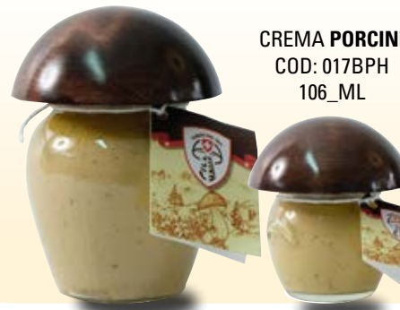
CREMA PORCINI COD: 017BPH 106_ML