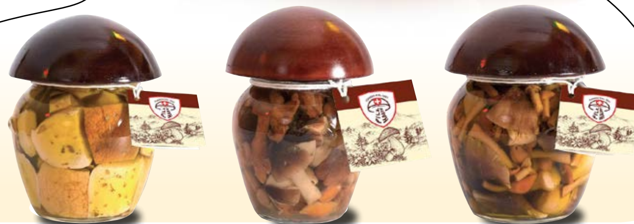
FUNGHI PORCINI TAGLIATI IN OLIO COD: 003APH_580_ML