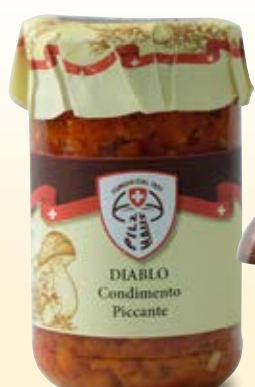
DIABLO CONDIMENTO PICCANTE COD: 028PH_314_ML