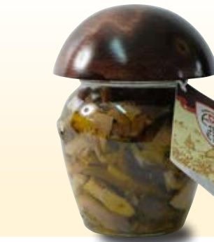
FUNGHI MISTI IN OLIO COD: 005MSPH_314_ML