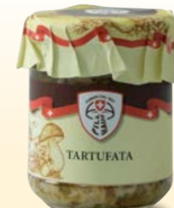
TARTUFATA IN OLIO COD: 018PH_314_ML