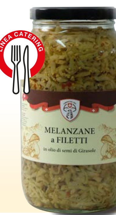
MELANZANE A FILETTI IN OLIO COD: 010CPH_5_KG