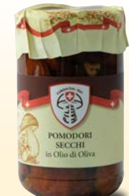
POMODORI SECCHI IN OLIO DI OLIVA COD: 027PH_314_ML