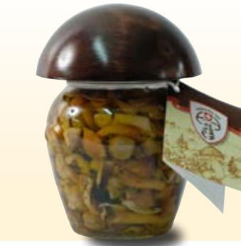
FUNGHI MONDIAL IN OLIO COD: 007MPH_314_ML