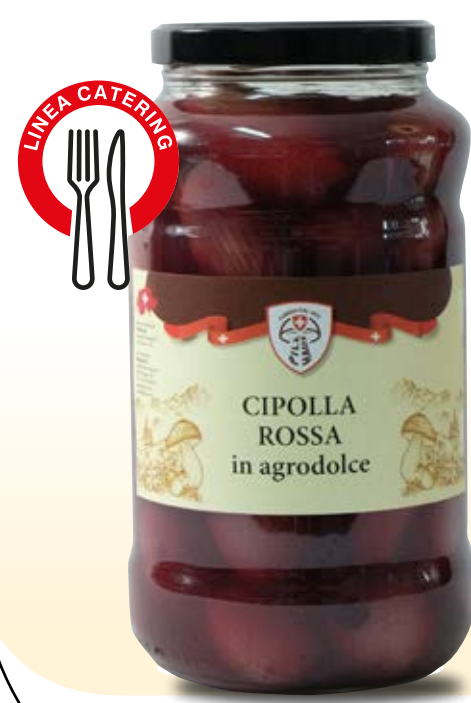
CIPOLLA ROSSA IN AGRODOLCE COD: 014CPH_5_KG