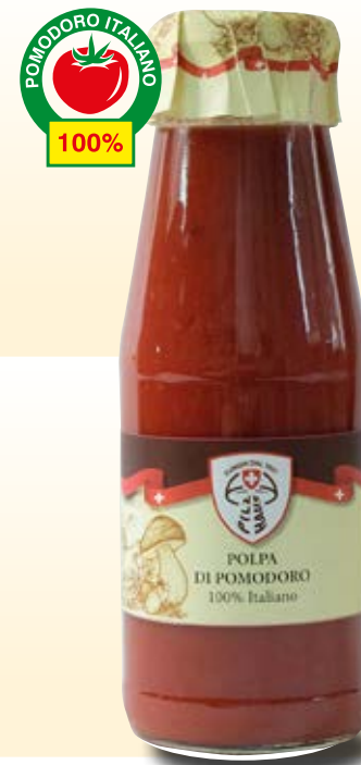
POLPA DI POMODORO COD: 025PH_720_ML