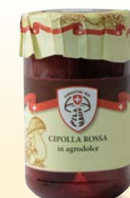
CIPOLLA ROSSA IN AGRODOLCE COD: 026PH_314_ML