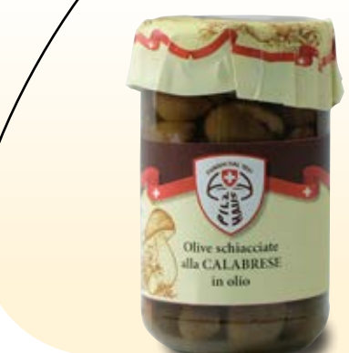
OLIVE SCHIACCIATE ALLA CALABRESE IN OLIO- COD: 029PH_314_ML