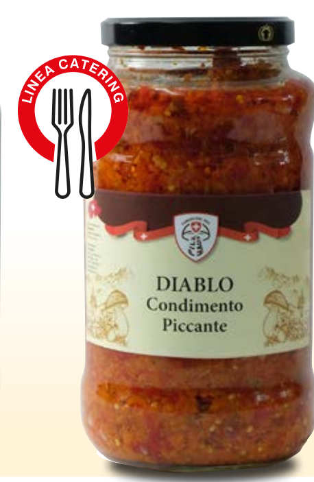
DIABLO CONDIMENTO PICCANTE COD: 012CPH_5_KG