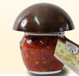
PEPERONCINO PICCANTE COD: 024PH_106_ML