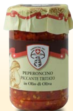
PEPERONCINO PICCANTE TRITATO IN OLIO DI OLIVA - COD: 019PH_314_ML