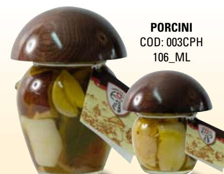
PORCINI COD: 003CPH 106_ML