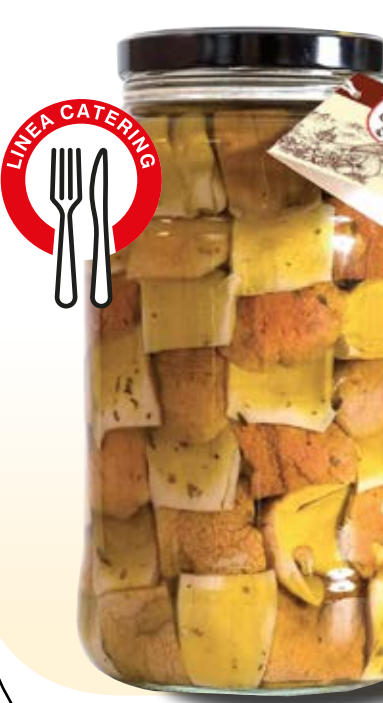
FUNGHI PORCINI TAGLIATI IN OLIO COD: 009CPH_5_KG