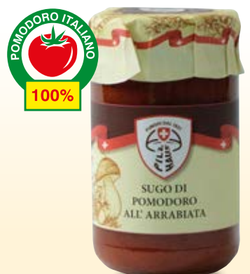
SUGO PICCANTE ALL'ARRABIATA COD: 022PH_314_ML