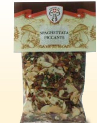
SPAGHETTATA ITALIANA PICCANTE- COD: 030PH_50_GR