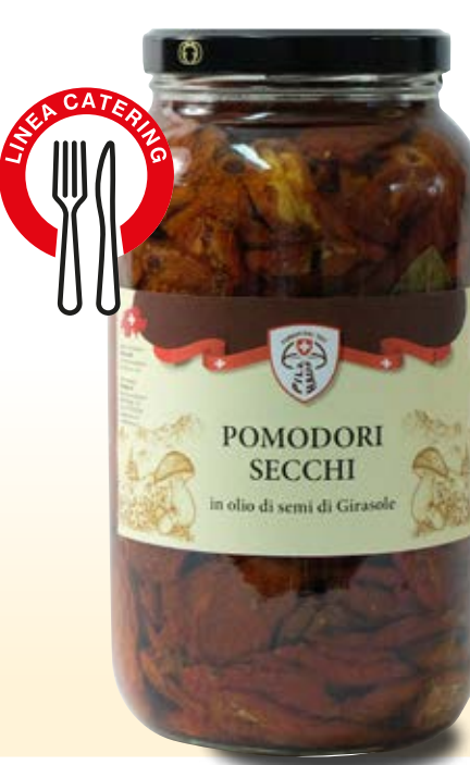
POMODORI SECCHI IN OLIO COD: 013CPH_5_KG