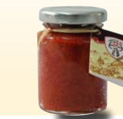
'NDUJA SALAME SPLAMBILE COD: 023PH_106_ML